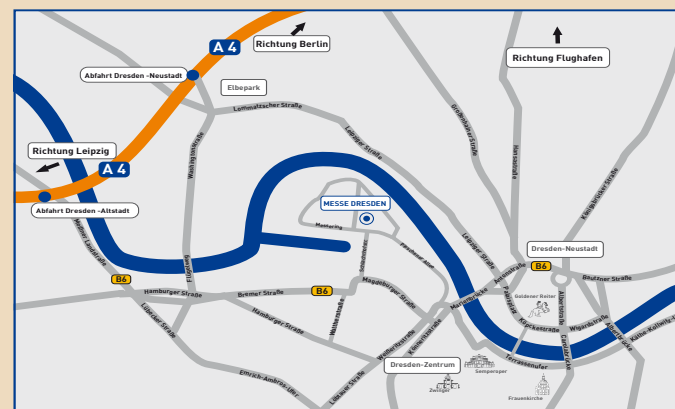
MESSE DRESDEN | Anfahrtsskizze Auto

MESSE DRESDEN GmbH | Messering 6, 01067 Dresden